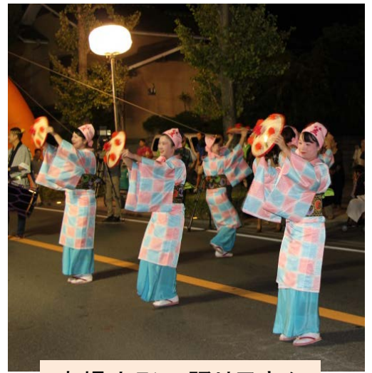
本場山形の踊り子さん