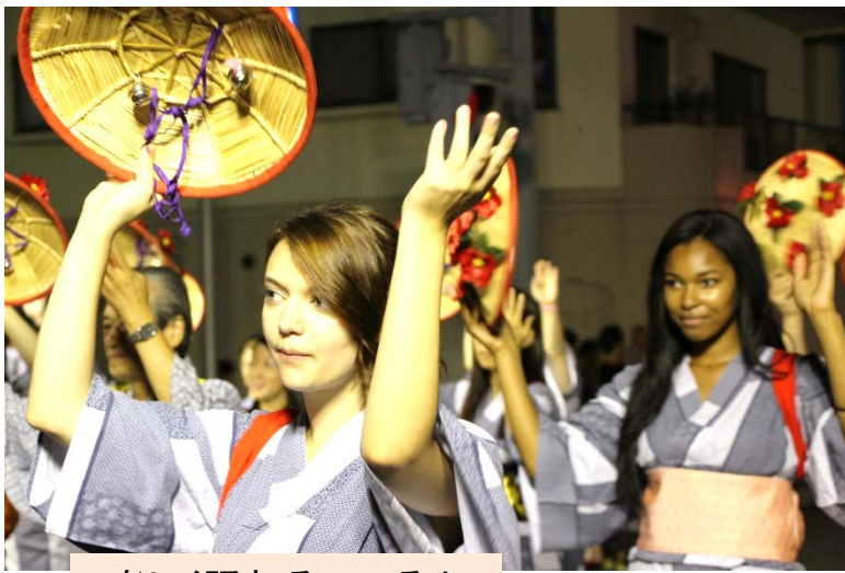
楽しく踊れているよ