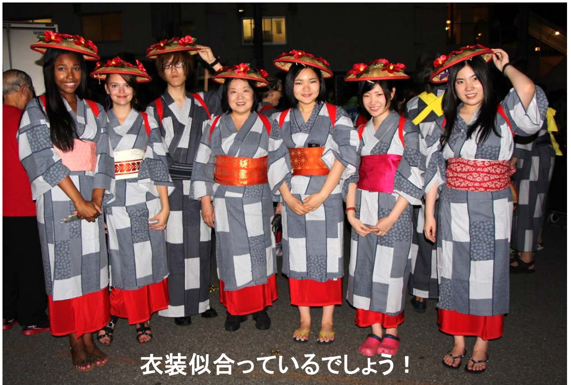
衣装似合っているでしょう！