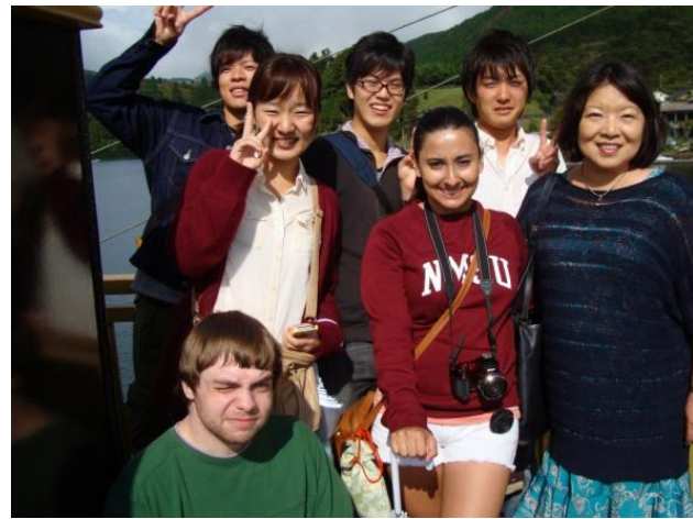
海賊船船上で エーイ