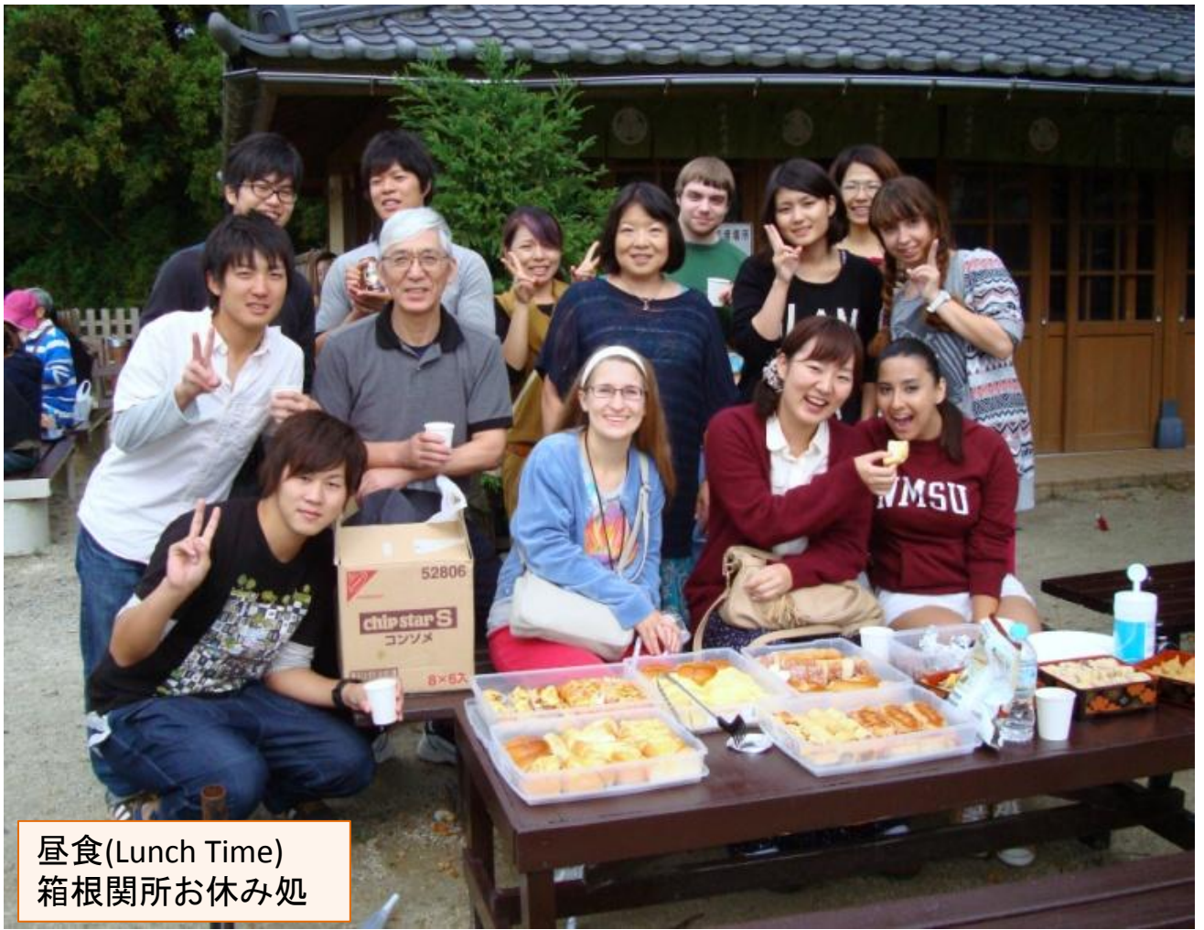
昼食(Lunch Time) 箱根関所お休み処