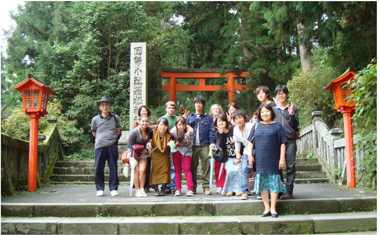
箱根神社で日本の神道のお参りの作法、日本の文化、荘厳な雰囲気味わう