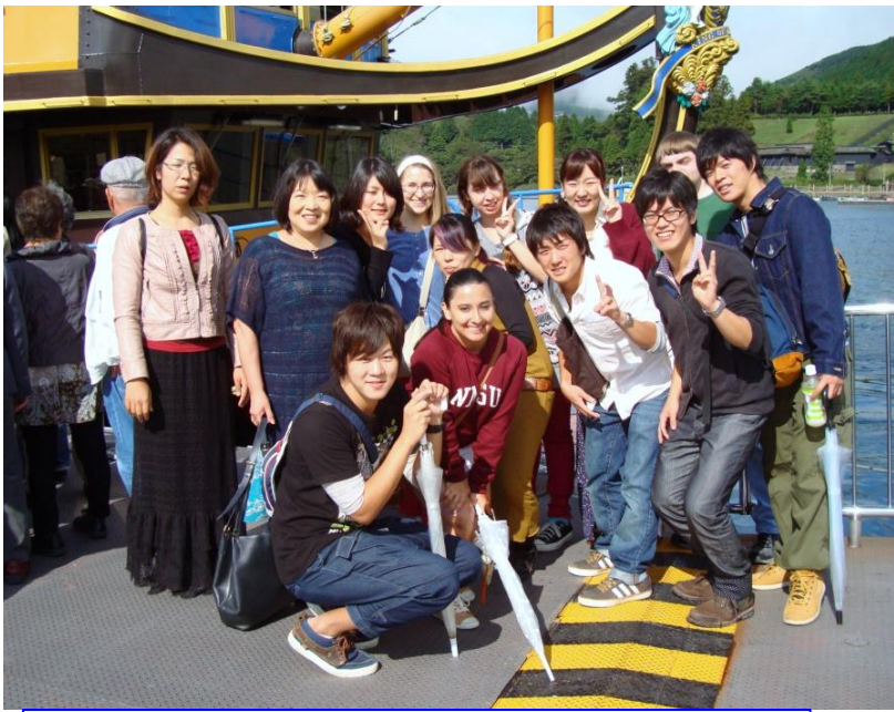
海賊船を体験、短い時間を大いに楽しむ