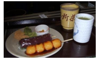
お団子とお汁粉 日本の食を楽し む、ラムネも賞味