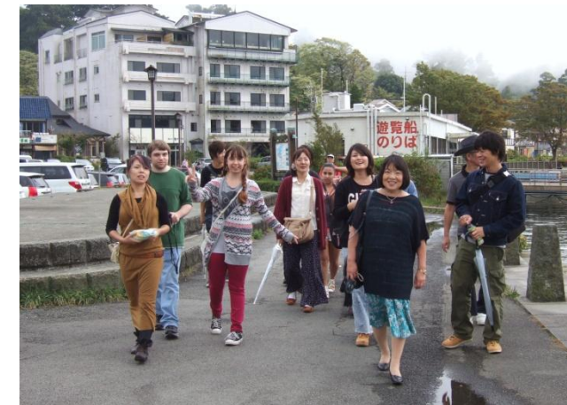
箱根神社まで1Kmのウォーキング