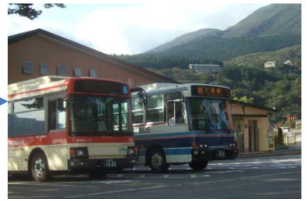
元箱根駅(Motohakone Bus Stp.)