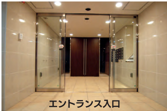
エントランス入口