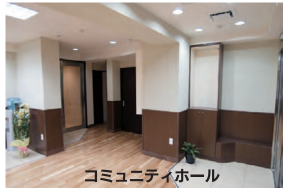
コミュニティホール