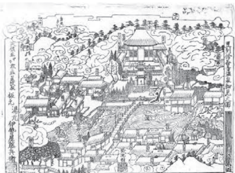
『豆州修善寺温泉細見之圖 (伊勢屋藤兵衛板)』(1835)