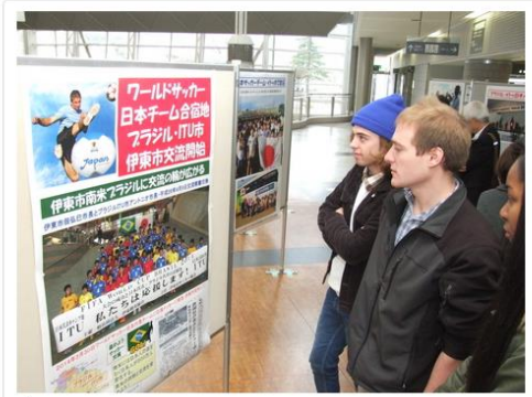
伊東市とイトゥー市の交流の様子などを紹介する展示会=市役所