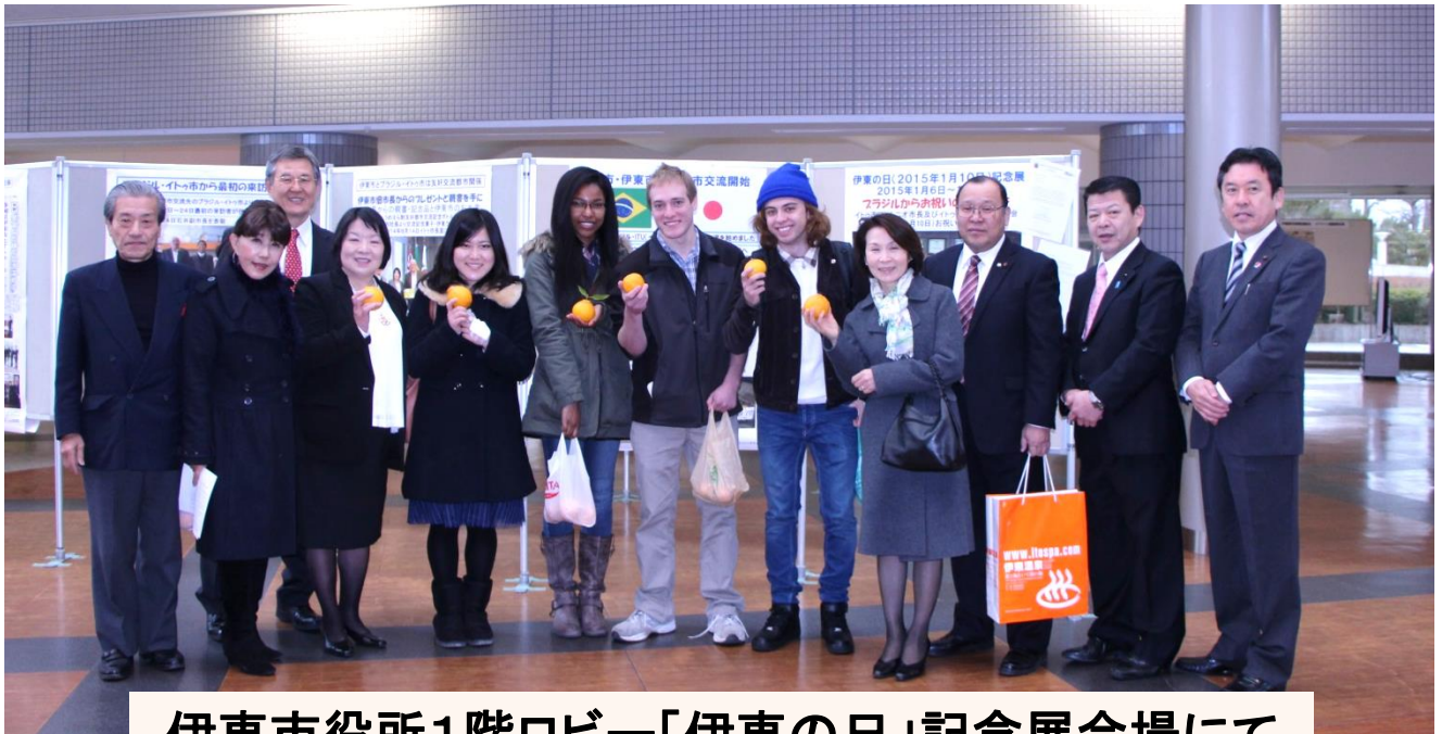
伊東市役所1階ロビー「伊東の日」記念展会場にて